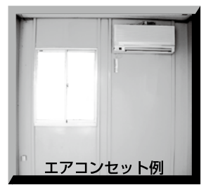
3尺窓(オプション) 専用ブラインド・カーテンはございません。